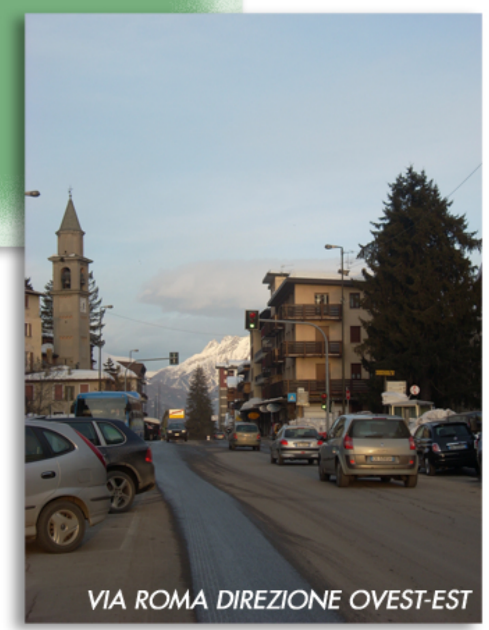
VIA ROMA DIREZIONE OVEST-EST