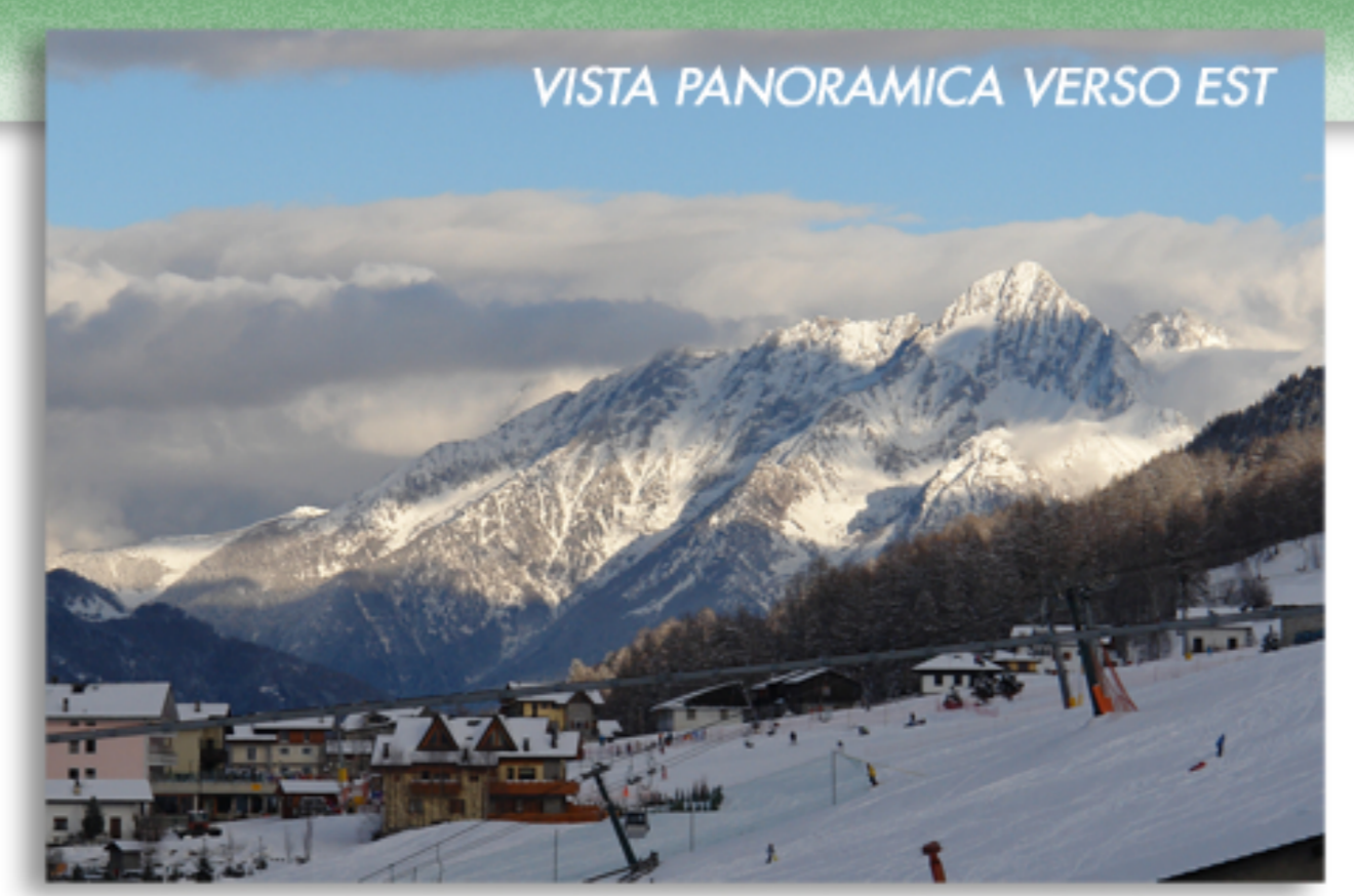
VISTA PANORAMICA VERSO EST