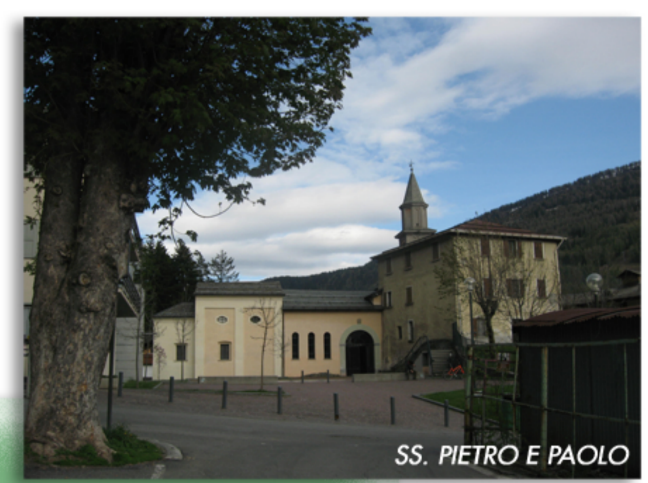
SS. PIETRO E PAOLO