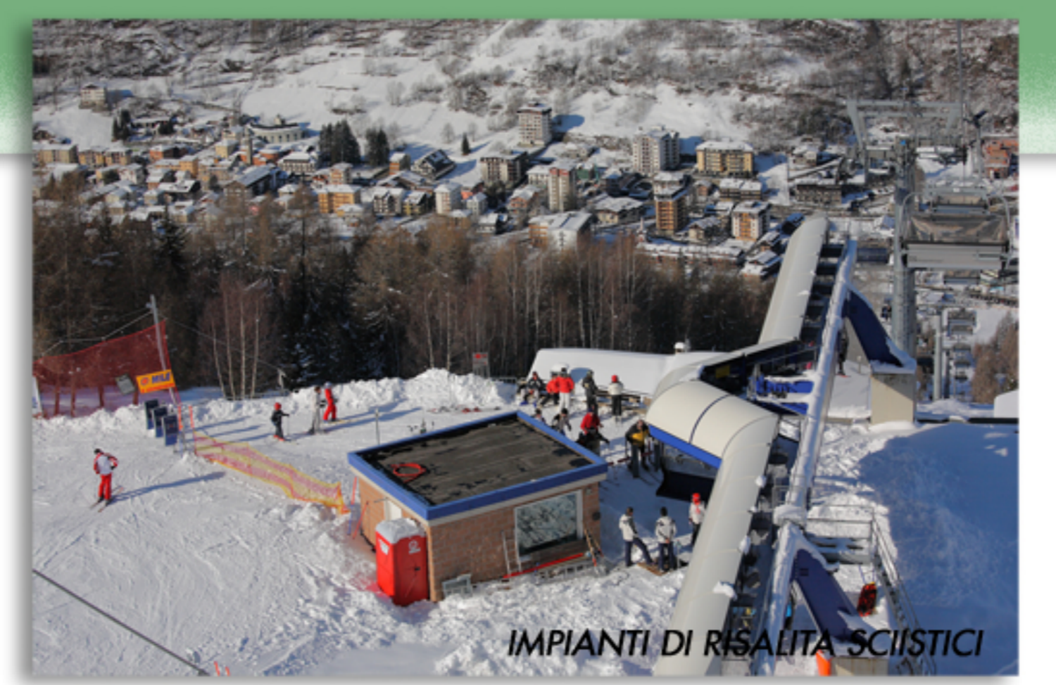
IMPIANTI DI RISORSA SCIISTICI