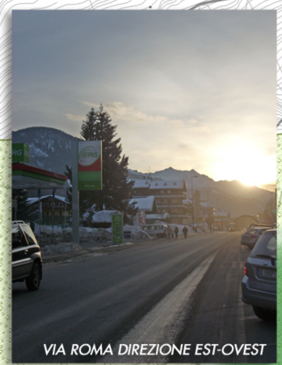
VIA ROMA DIREZIONE EST-OWEST