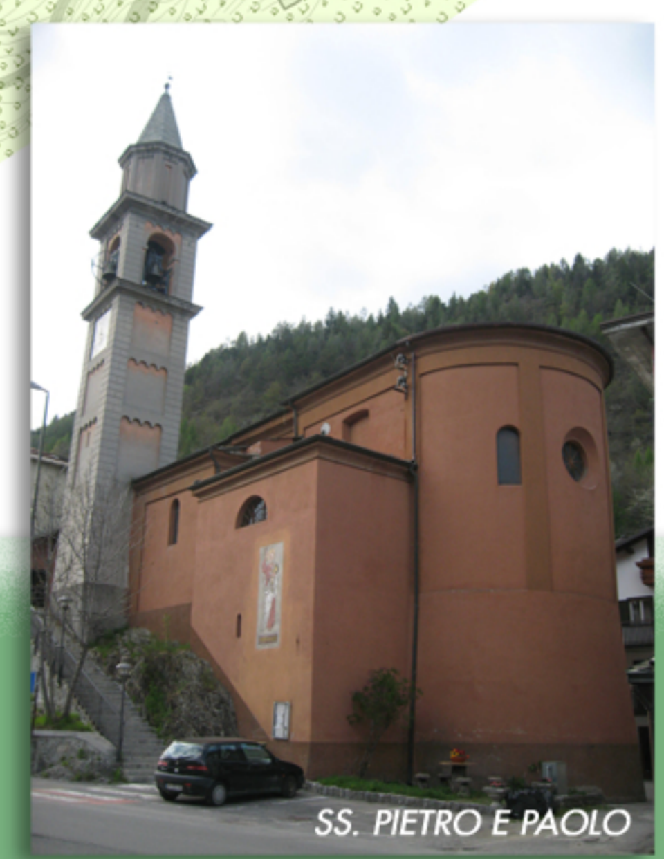
SS. PIETRO E PAOLO