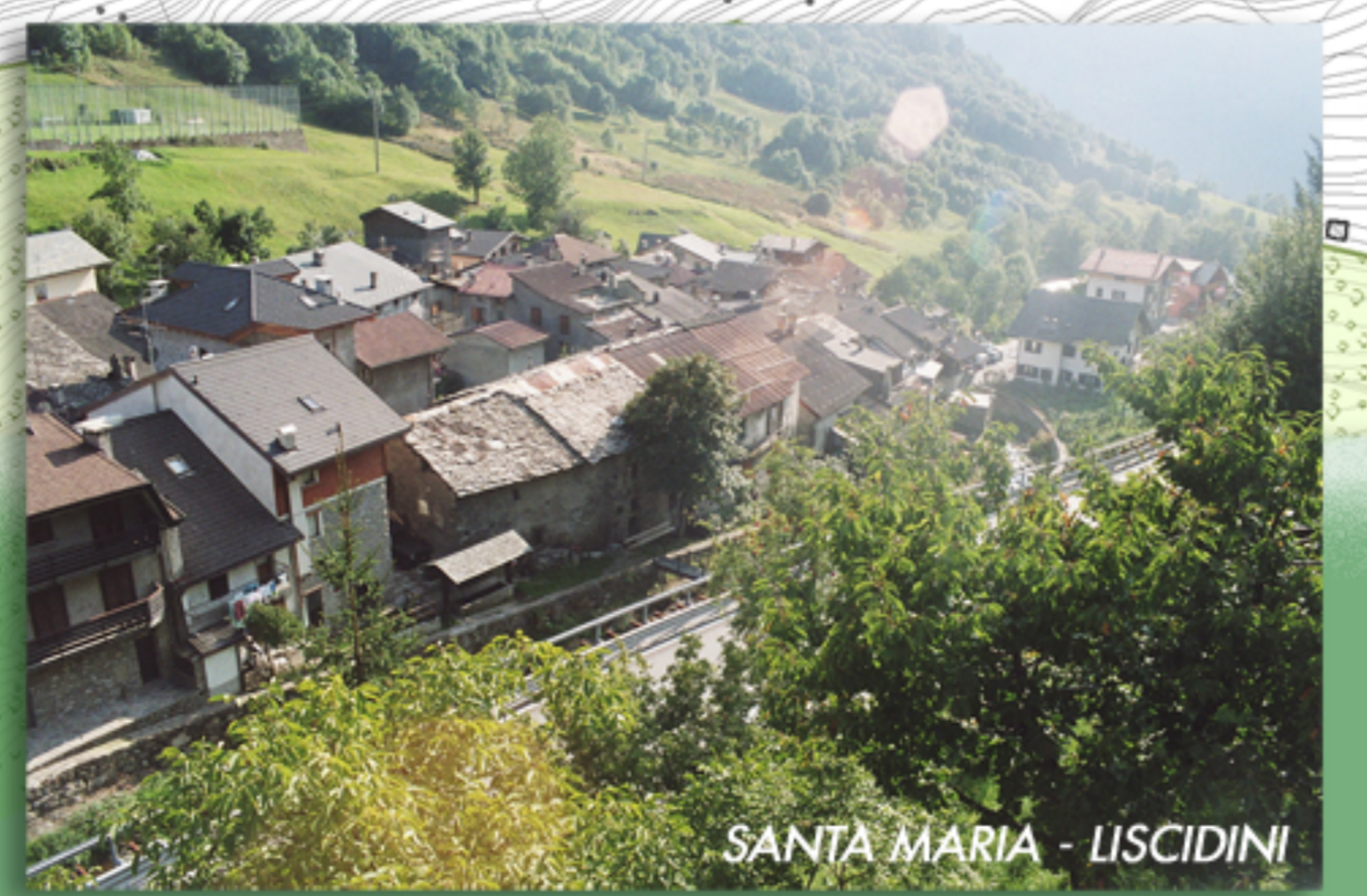
SANTA MARIA - LISCIDINI